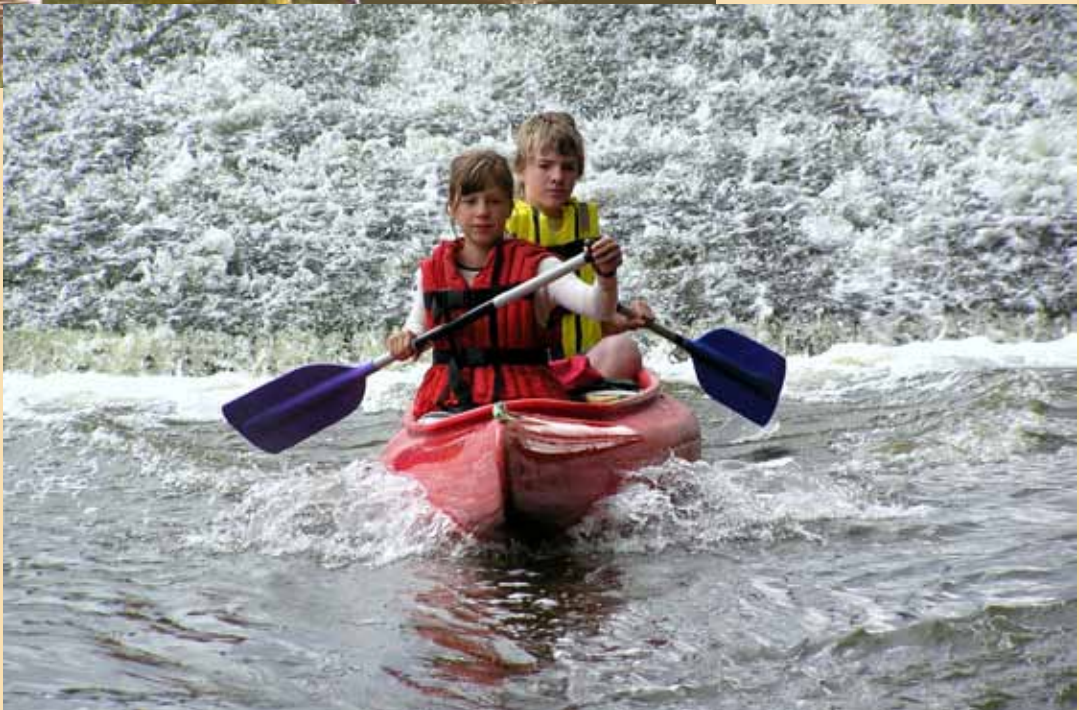
Sázava 2009 ▼