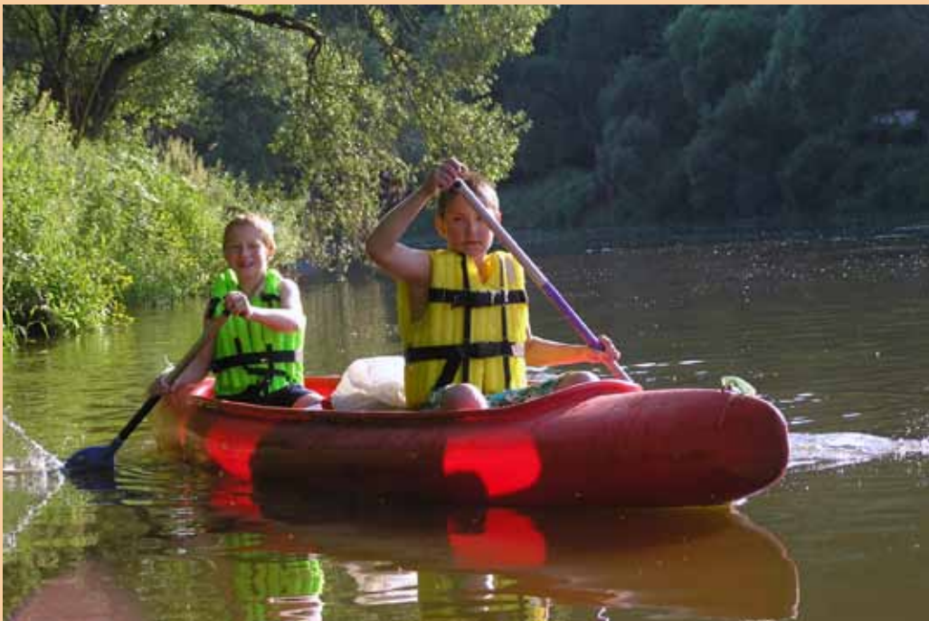
Sázava 2009 ▼